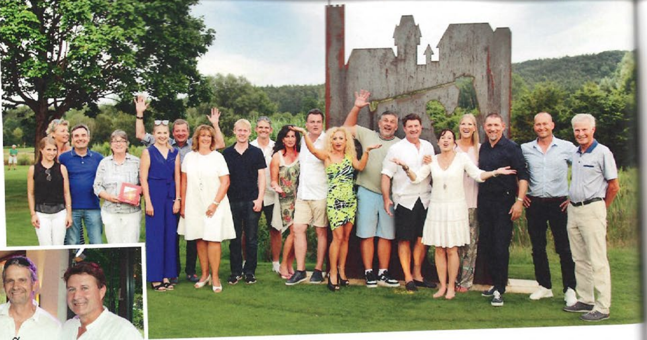
Die Sieger und Sponsoren nach einem erfolgreichen Tag.