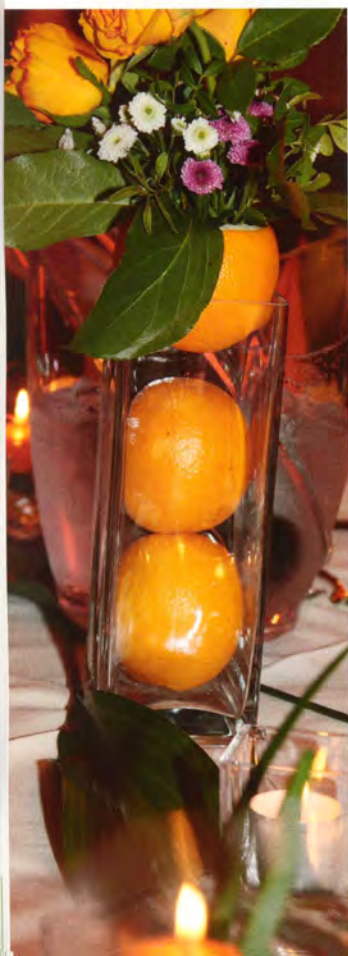
◀ Orangen und Blüten als Tischschmuck.