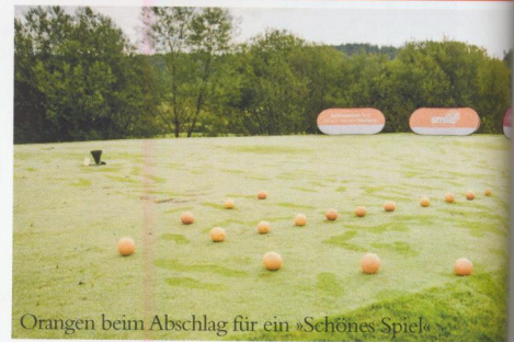
Orangen beim Abschlag für ein »Schönes Spiel«